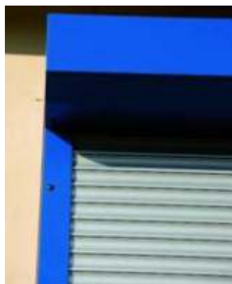
Standardkasten (stranggepresst u. Rollverformt)