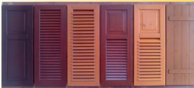
Füllung Jalousie Rustikal Füll/Jal. Füll/Rustikal Landhaus